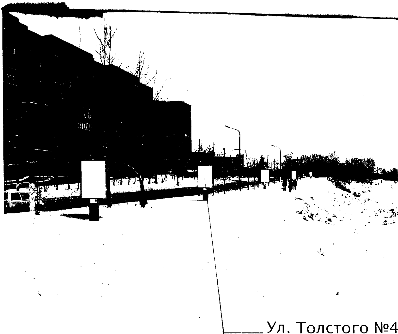
Ул. Толстого №4